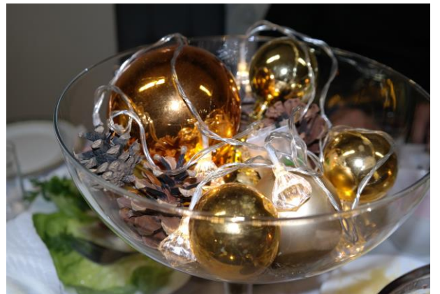
Opracowała: Róża Nowak – Dyrektor.