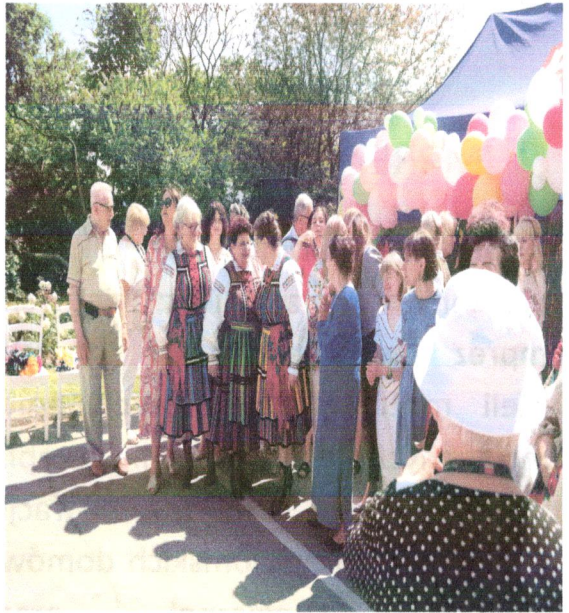
Opracowała: Róża Nowak – Dyrektor Domu.